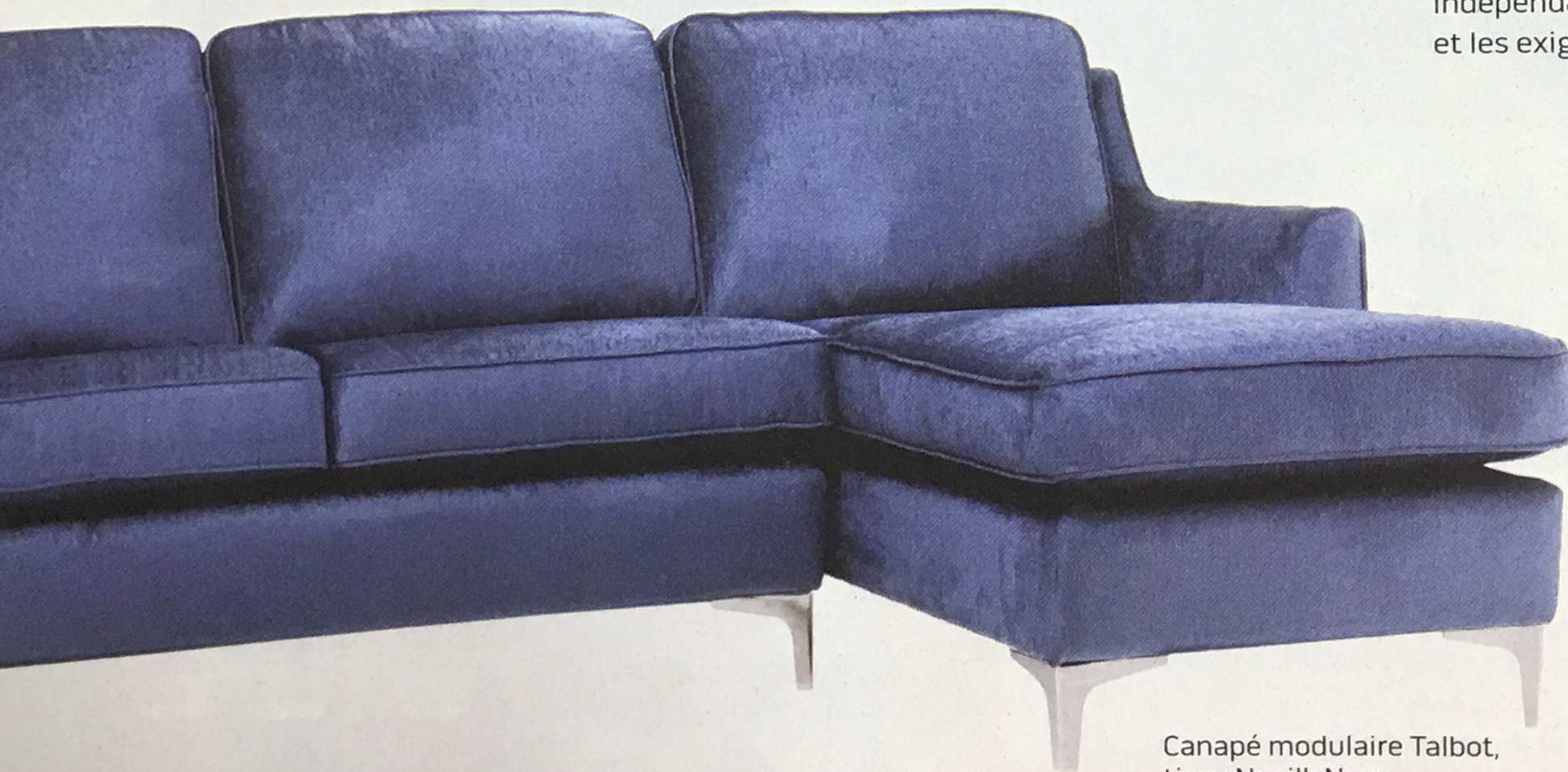
Canapé modulaire Talbot, tissu Nusilk Navy, fait sur mesure, prix sur demande Jaymar