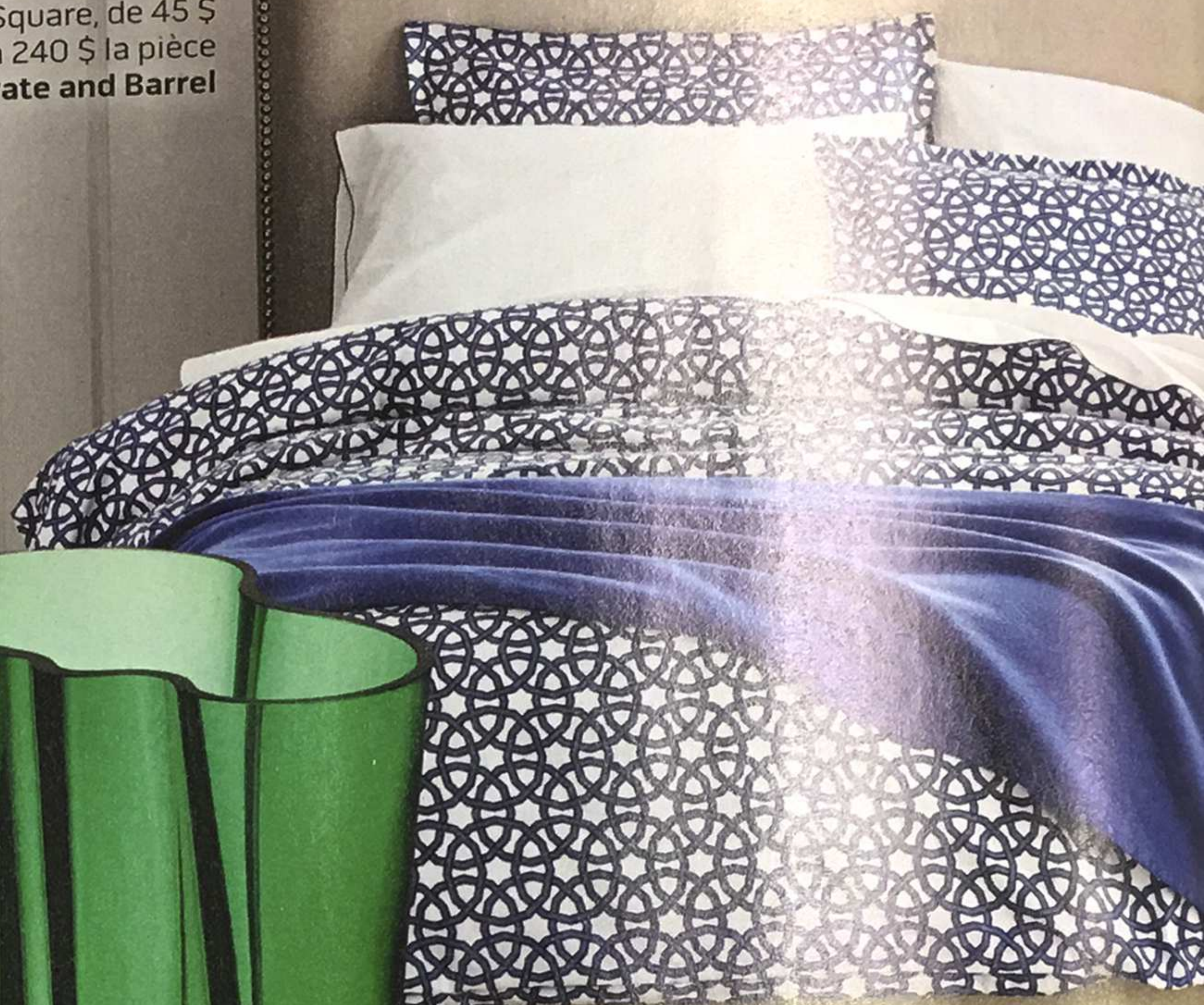
Literie de la collection Union Square, de 45 $ à 240 $ la pièce Crate and Barrel